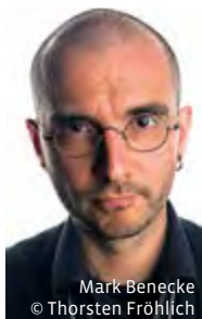
Mark Benecke