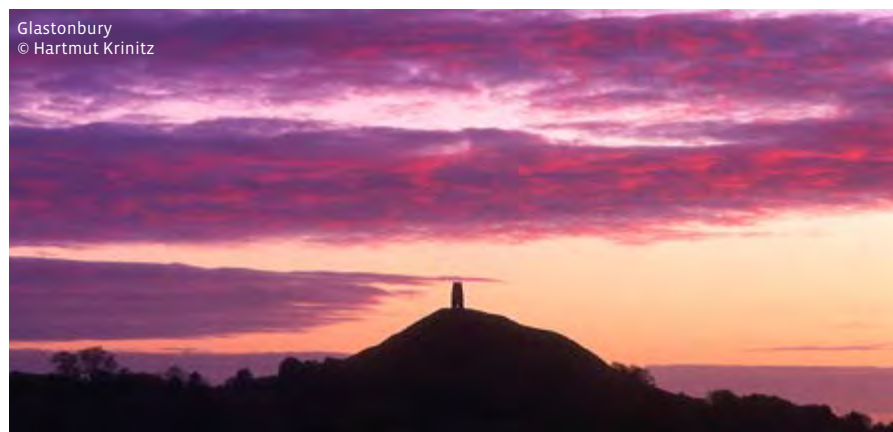
Glastonbury © Hartmut Krinitz