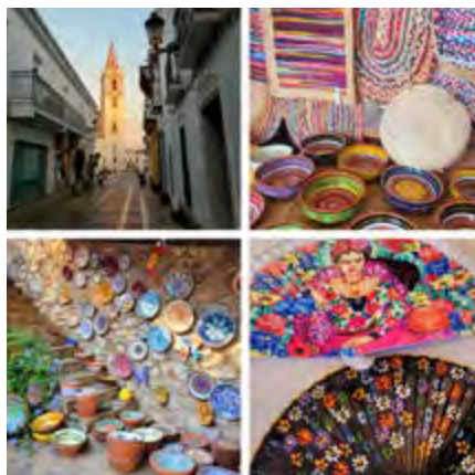
Sierra de Aracena