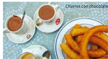
Churros con chocolate

Leitung: Dorothe Winkler Termine: ab Mi, 28.1.2026, 19.45 - 21.15 Uhr Ort: Fritz-Lange-Haus, Friedrichstr. 7 Dauer: 16 Termine, 32 U.Std. Entgelt: 156,80 € (keine Ermäßigung)