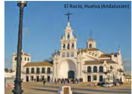
El Rocío, Huelva (Andalusien)