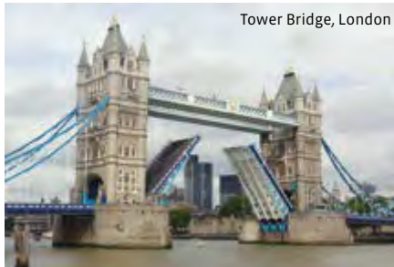
Tower Bridge, London