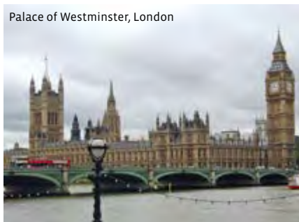
Palace of Westminster, London