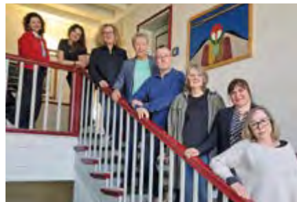
Dozenten für Deutsch als Zweitsprache

Im Rahmen aller Deutschkurse besuchen Teilnehmer:innen, die ihre neue Heimat Gladbeck besser kennen lernen wollen, z. B. die Stadtbibliothek, das Museum der Stadt Gladbeck im Wasserschloss Wittringen oder die Städtische Galerie.